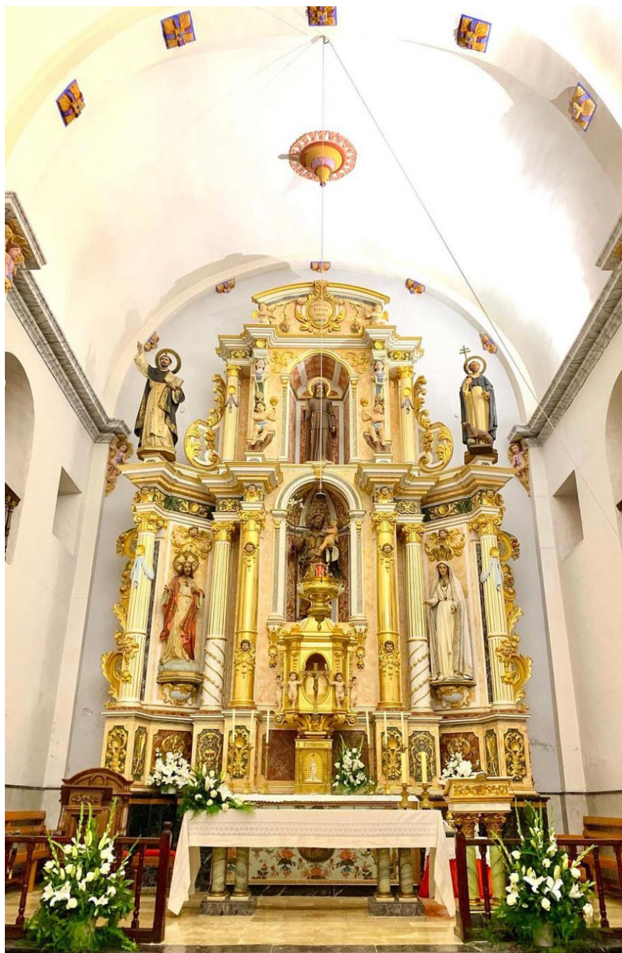
Església de Sant Josep